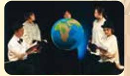
2023年1月開催 「歌と語りで綴る田中館愛橋物語」

実施日時 9/2(土)、9/3(日) 各日とも開演 14:00 ※開場は開演30分前 会場 もりおか町家物語館・浜藤ホール 料金 ¥1,000 定員 80名 内容 橋不染著『もりおか明治船来づくし』、松本源蔵著『わたしの盛岡』の2作品を盛岡版朗読劇として上演。盛岡で継承される文化芸術を代表して盛岡芸妓の歌舞音曲も上演。