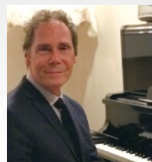
音楽 Frank Weber