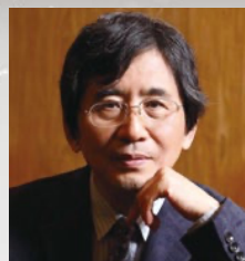
演出 鵜山 仁 (文学座)