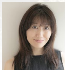
舞台美術 米澤 純 (Jun's Light)